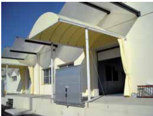
AREA SCARICO MERCI DEL PIF DI CIVITAVECCHIA