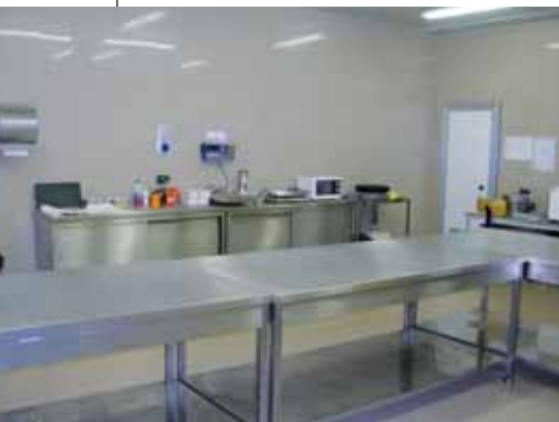
STRUTTURE ISPETTIVE DEL PIF AEROPORTUALE DI MALPENSA

Attualmente i Bip dell'Ue sono 270, di cui 23 Pif italiani (attivi). Sono autorizzati direttamente dalla Commissione europea, su proposta dello