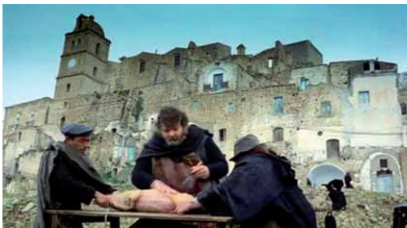
(DAL FILM "CRISTO SI È FERMATO A EBOLI" DIRETTO DA FRANCESCO ROSI, TRATTO DAL ROMANZO OMONIMO DI CARLO LEVI)

"Il Congresso dei Medici Comunali riunito in Campidoglio, consapevole della condizione miseranda dei veterinari italiani, nel mentre manda un saluto ai confratelli di lotta e di sacrifici, li incoraggia a combattere per la rivendicazione dei loro diritti e per