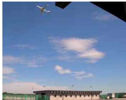
CENTRO ISPEZIONE ANIMALI VIVI PIF DI MALPENSA

terzi la gestione e la registrazione dei dati sulle spedizioni di tutte le merci soggette a controllo veterinario, mentre negli scambi intracomunitari consente di tracciare solo la movimentazione degli animali e di alcune limitate tipologie di prodotti di origine animale.